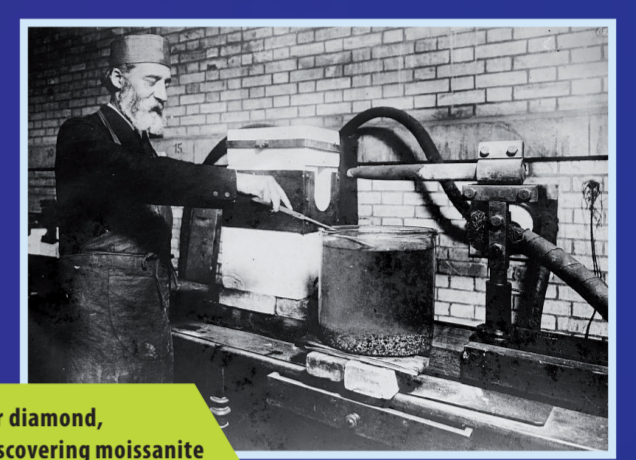
Henri Moissan trying to create diamond in his laboratory