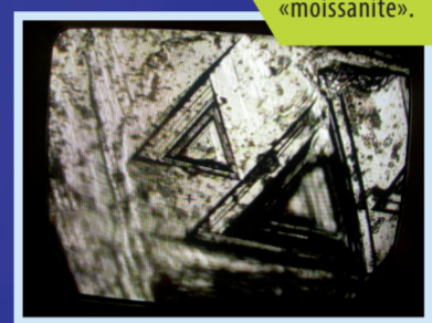
Growth forms in diamonds studied by Charles and Georges Friedel.