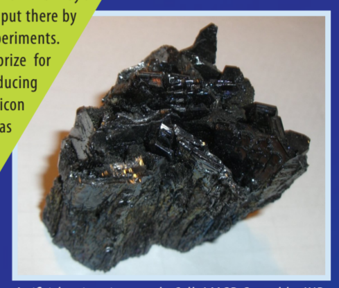
Artificial moissanite crystals, Coll. LMGP Grenoble-INP

All sorts of experiments were performed up to the middle of the 20th century using very high pressure, in attempts to produce artificial diamond. Hannay and Moissan believed they had found science's Philosopher's stone, but... - the diamonds found in the samples obtained Hannay's experiments with explosives seem to have been put there by workers hoping to put a stop to dangerous experiments. - Moissan, who was awarded the Nobel prize for chemistry in 1906, succeeded in producing very hard crystals, but they were of silicon carbide (SiC) and are now known as «moissanite».