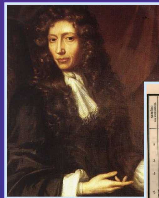
Robert Boyle (1627-1691)

At the beginning of the 20th century X-rays showed scientists the internal structure of both diamond and graphite; they are both very different.